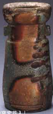
藤原雄「備前窯変花入」

きびプラザ 〒716-1241 岡山県加賀郡吉備中央町吉川4860-6 TEL.0866-56-7010