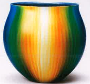
三代徳田八十吉「耀彩花器」

【展示作品】 歌川広重、十四代酒井田柿右衛門、藤原啓、北大路魯山人、パブロ・ピカソ、ジョルジュ・ルオー、梅原龍三郎、藤田嗣治、安井曾太郎、竹久夢二、川端龍子、草間彌生、エミール・ガレ、ドーム 他 全約120点