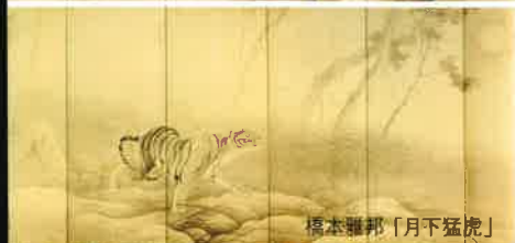
橋本雅邦「月下猛虎」