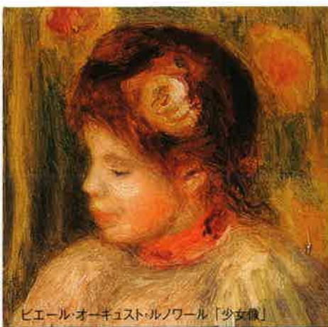
ピエール・オーキュスト・トルノワール「少女像」