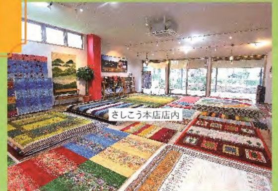
さしこう本店店内