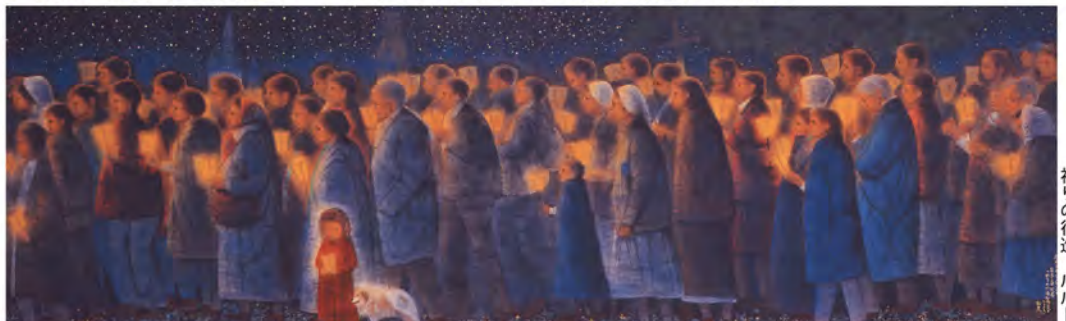
祈りの行進 ルルド