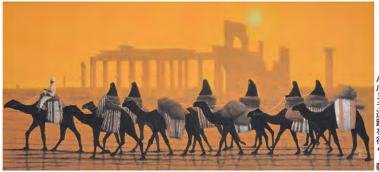
バルミラ遺跡を行く 朝