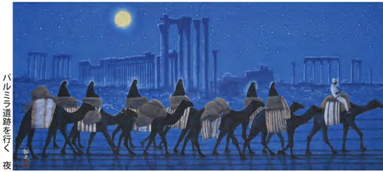
バルミラ遺跡を行く 夜