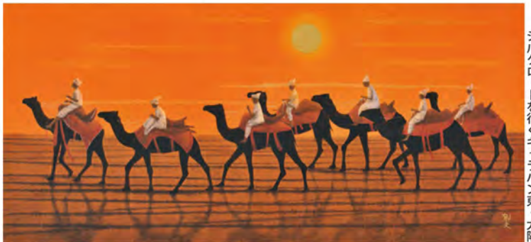
シルクロードを行くキャラバン東・太陽

仏教伝来 (1959年) から祈りの行進ルルド (2008年) まで40点の作品を展示