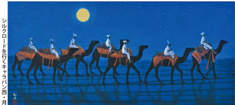
シルクロードを行くキャラバン西・月