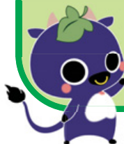
新見市マスコットキャラクター にーみん