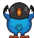
吉備中央町のマスコットキャラクター フッポウソウの「ハそっぴー」