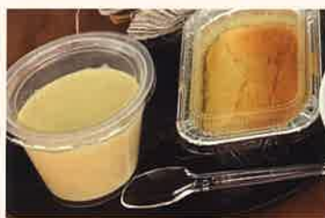
自然薯プリンとチーズケーキ