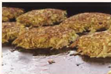
自然薯入りお好み焼