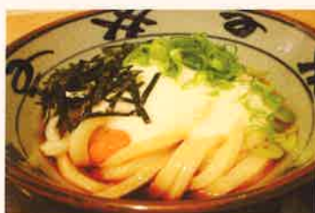
自然薯とろろうどん