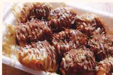
自然薯入りたこ焼き